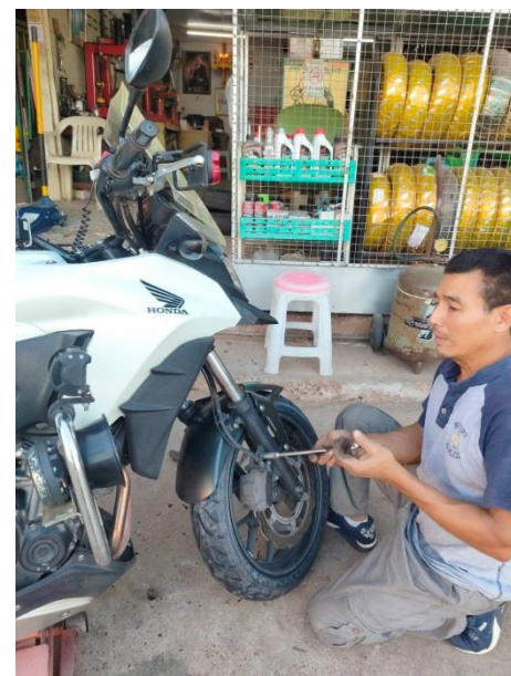
ทะเบียน 1กณ 7818 นพ.

ภาพประกอบการสำรวจและตรวจสอบ และซ่อมบำรุงยานพาหนะของทางราชการ ของ สภ.ธาตุพนม รอง ผกก.ป.ฯ/หน.จนท.ตรวจสอบ ณ วันที่ 2 ม.ค.2567 ประจำเดือน/( ไตรมาสที่ 2 )